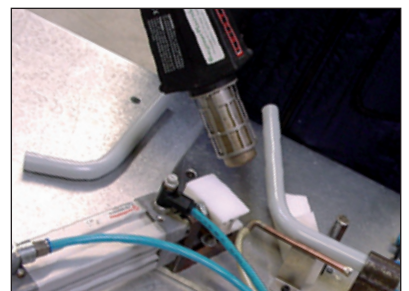
Ved jævn opvarmning over et større stykke sikrer du nemt en pæn og jævn bøjning