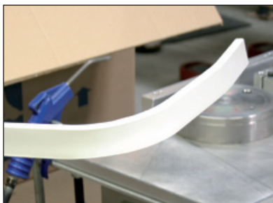
Efter nedkøling har listen opnået den ønskede bøjning

Vi gør opmærksom på at bukning af lister ved hjælp af opvarmning kræver nogen øvelse, det kan derfor være en god idé at prøve sig lidt frem først.