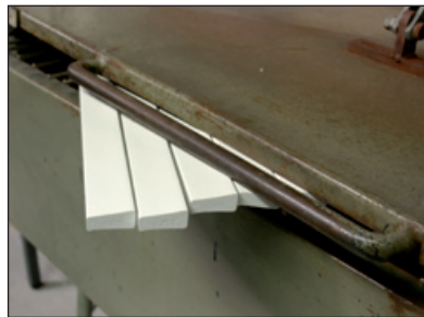
I varmeovnen bliver listerne varmet op til ca. 60 - 70°C