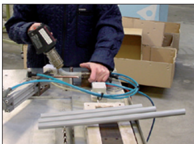
Efter opvarmning med føn kan listerne bøjes/ bukkes i den ønskede form