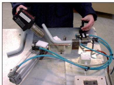
Vær opmærksom på ikke at punktopvarme listen, da den i så fald kan blive deform