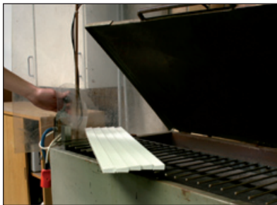
Listerne lægges i varmeovn