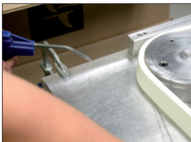
Herefter bukes listen og køles ned med kold luft